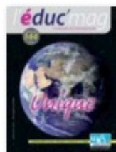
UNSA Education éducMag