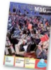
UNSA UNSA Mag